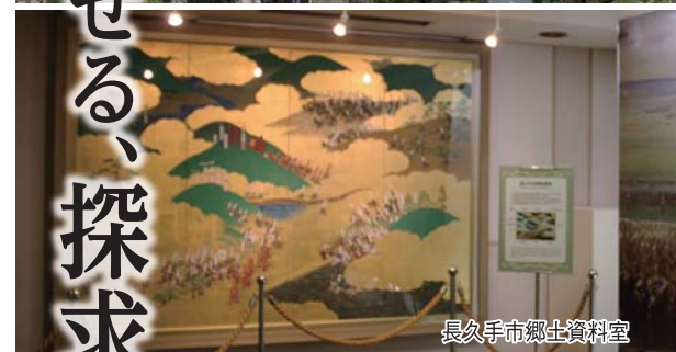
長久手市郷土資料室