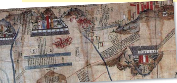
「小牧陣御進發之図」写 和歌山市所蔵(一部抜粋)