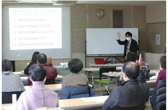
日進市民会館にて講座を行いました